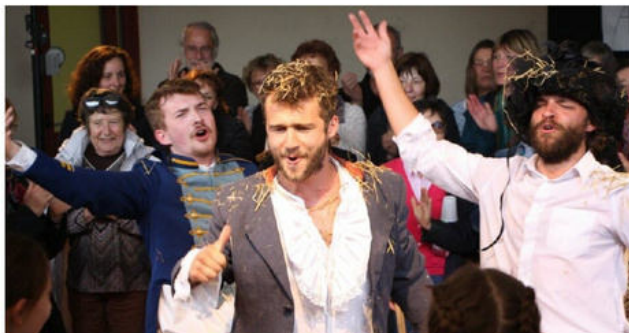
Trois comédiens survitaminés tiennent les dix rôles de la pièce.

De notre correspondant Christophe MARTIN - 26 nov. 2022 à 22:38 - Temps de lecture : 2 min