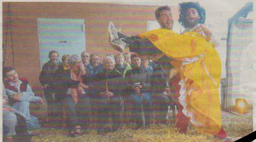
La compagnie 800 litres de paille a séduit le public.