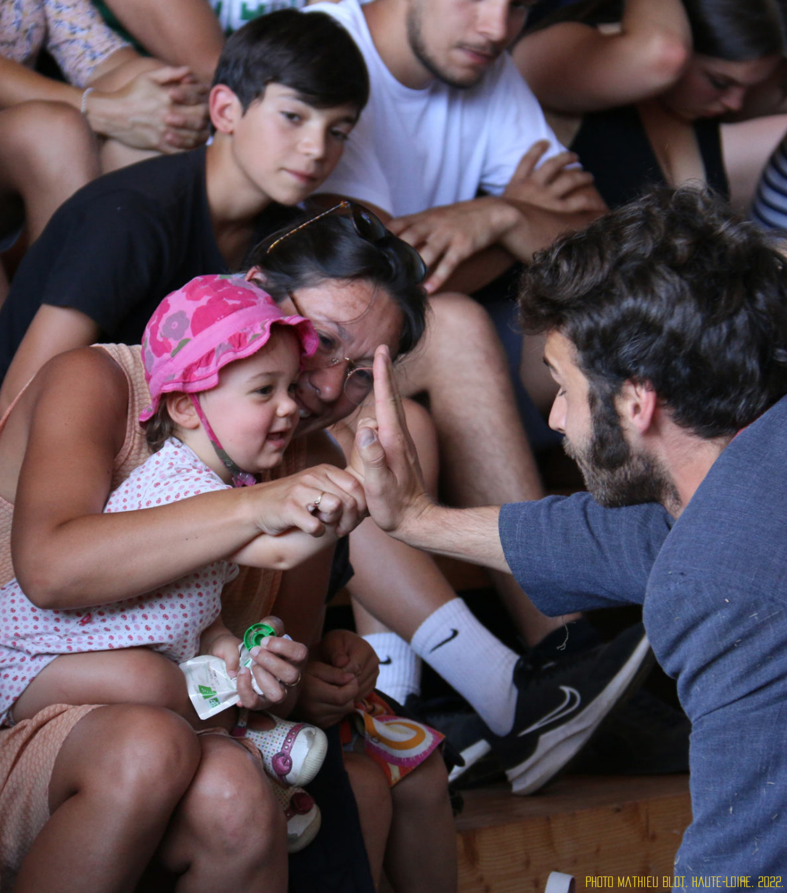
HAUTE-LOIRE, 2022.