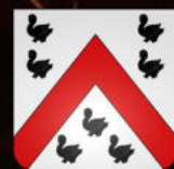
SAÔNE ET LOIRE, 2023.

MINISTÈRE DE LA CULTURE Liberté Égalité Fraternité