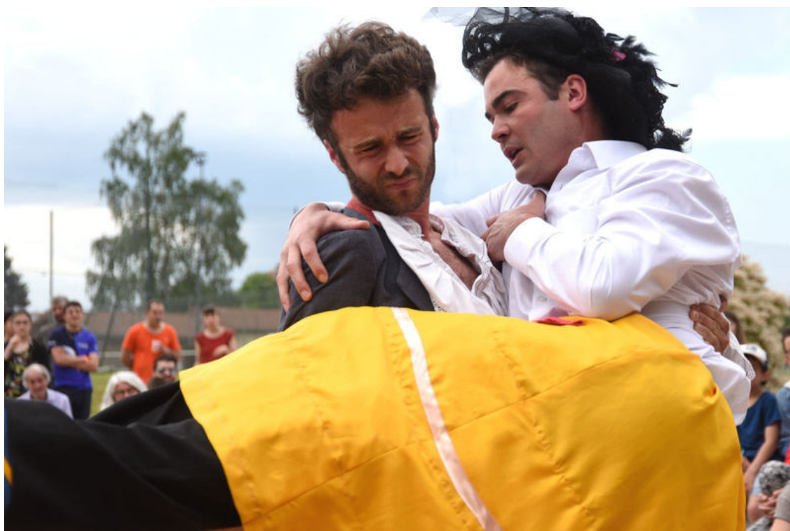
Le mariage : un jeu de dupes pour les personnages ?

Dorimène est une jeune fille issue de la noblesse désargentée. Elle est maltraitée par une famille où la brutalité domine et pense échapper à son environnement grâce à un mariage avec ce vieil homme. Néanmoins, cette jeune coquette appétissante et faussement stupide ne se fourvoie-t-elle pas en concevant le mariage avec un vieil homme comme une échappatoire ? Elle affiche un drôle de cynisme (dépenser l'argent de Sganarelle pour être conquête ; recevoir/faire la fête ; entretenir des relations extra-conjugales) dans ses paroles. Mais elle n'entend pas les fantasmes de son vieux fiancé qui veut la posséder quand bon lui semble, jouir de son jeune corps à loisir. Elle veut ignorer que ce cinquantenaire semble encore vert et vigoureux anéantissant son espoir d'un veuvage rapide synonyme d'une plus grande liberté d'action pour elle.