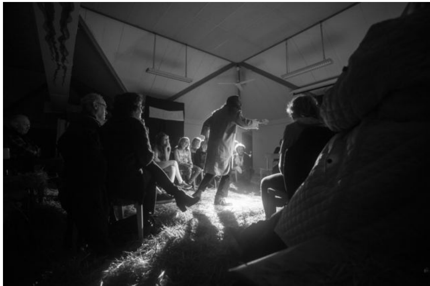
Installation du dispositif dans deux salles différentes.

> Demander aux élèves ce que leur a fait ressentir ou penser le fait de voir les autres spectateurs / spectatrices pendant la représentation. Chacun.e note sur une bande de papier une phrase répondant à la question, qui peut rendre compte soit d'une impression générale, soit d'un détail ou d'un moment particulier. Installer les élèves sur des chaises disposées en carré, comme dans le spectacle. L'un.e des élèves adresse à un.e autre la phrase qu'il a notée et celui-ci à son tour en fait de même jusqu'à ce que tous et toutes se soient exprimé.e.s. Faire une synthèse commune des impressions formulées.