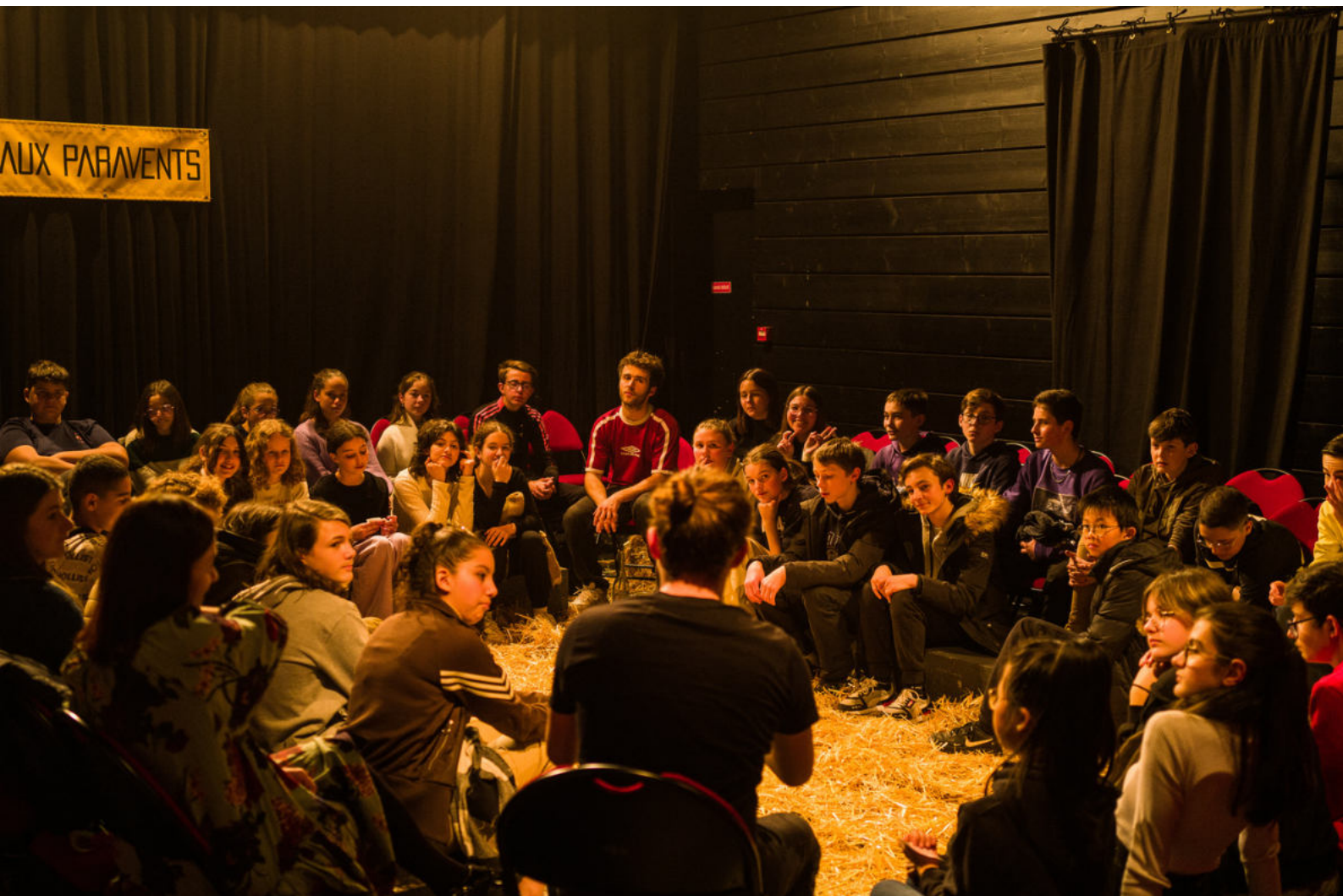
Le traditionnel "bord plateau".

Enfin, la volonté de rapprochement avec le public qui guide le spectacle aboutit logiquement à l'échange qui est proposé à la fin, où les trois comédiens répondent aux questions et expliquent leur démarche.