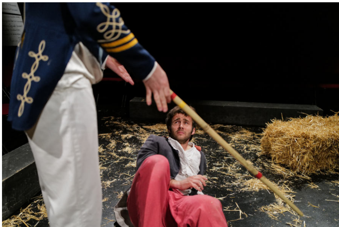
Sganarelle : une descente aux Enfers.