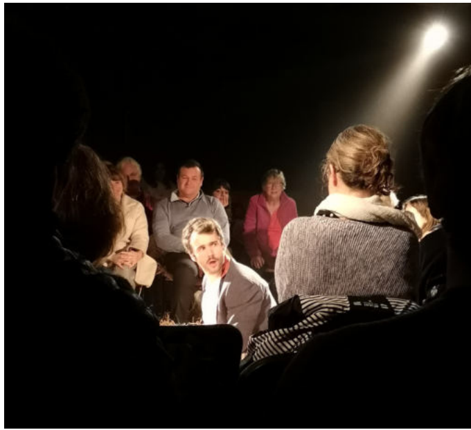
Le public dans la lumière, comme les comédiens.

Quelles que soient les réactions exprimées par les élèves, voir les autres spectateurs / spectatrices, leur regard, leurs réactions, leurs émotions, contribue à faire de la représentation une expérience commune. Cela crée aussi la possibilité d'intégrer le public dans le jeu.