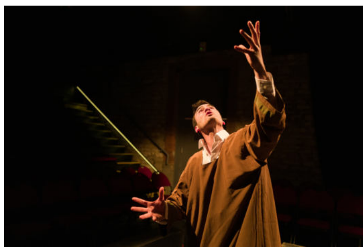
Recherche de l'expressivité des corps.