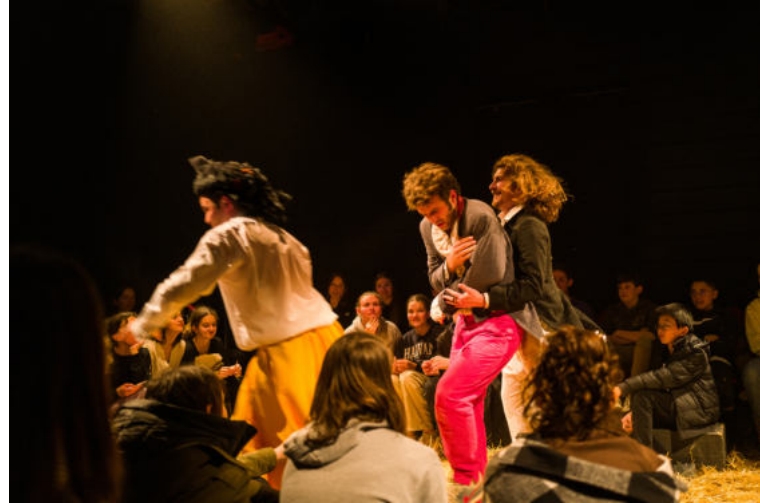
Une représentation toujours en mouvement.

Ce qui captive et séduit dans le spectacle, c'est avant tout l'énergie, la justesse et la précision du jeu des trois comédiens, tous présents en scène quasiment en permanence. La mise en scène déploie le rythme nécessaire à la farce (cascades, courses poursuites par exemple) et à la construction des personnages (changements de costume très rapides, ressort donné pour jouer une femme en étant un homme, travestissement des voix, etc.)