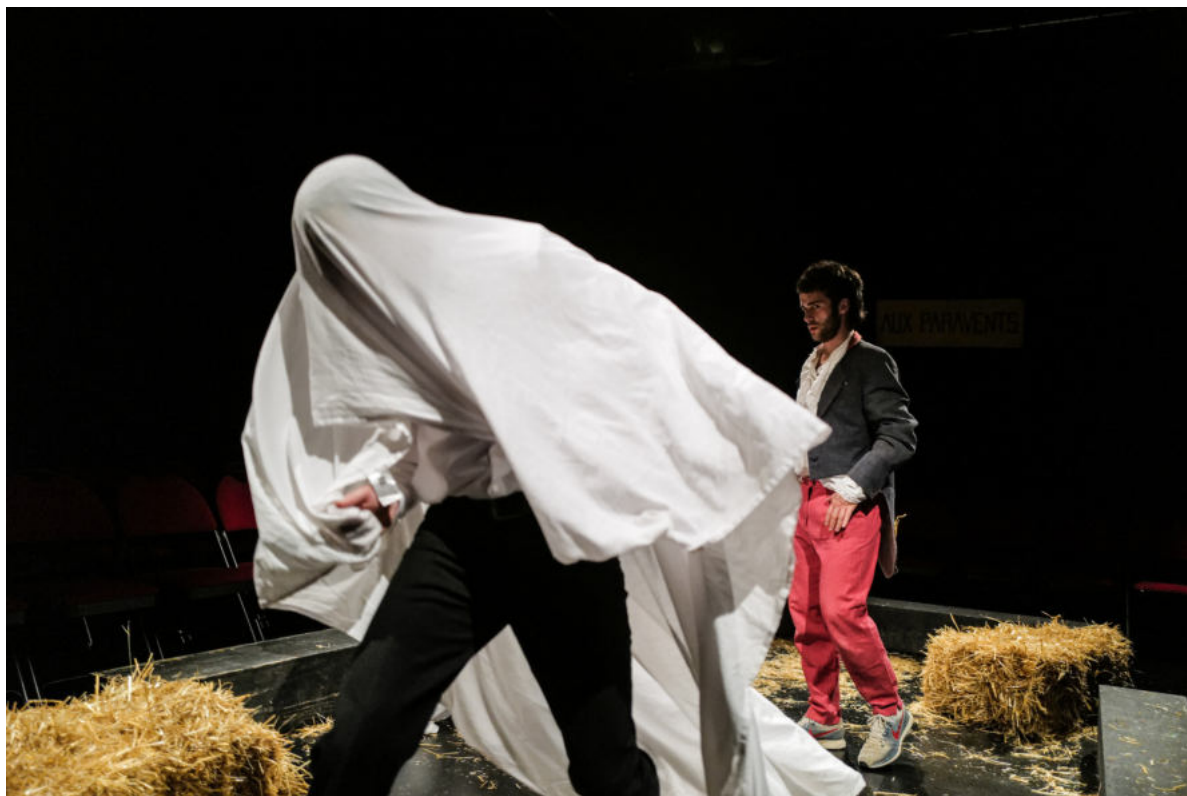
Sganarelle et les Egyptiennes .

Quant aux Egyptiennes, elles se défilent au moment de dire une vérité difficile mais salvatrice.