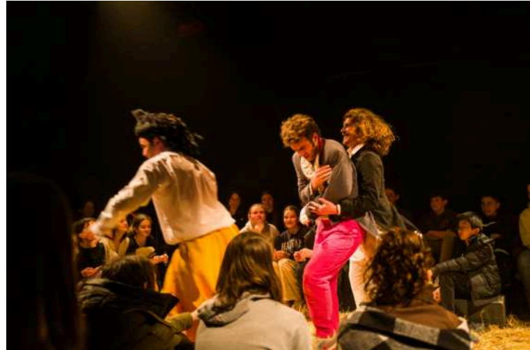
Une représentation toujours en mouvement.

Ce qui captive et séduit dans le spectacle, c'est avant tout l'énergie, la justesse et la précision du jeu des trois comédiens, tous présents en scène quasiment en permanence. La mise en scène déploie le rythme nécessaire à la farce (cascades, courses poursuites par exemple) et à la construction des personnages (changements de costume très rapides, ressort donné pour jouer une femme en étant un homme, travestissement des voix, etc.)