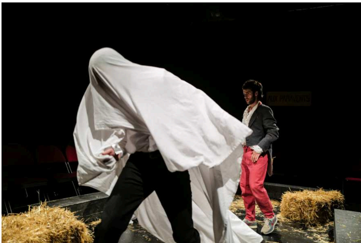
Sganarelle et les Egyptiennes .

Quant aux Egyptiennes, elles se défilent au moment de dire une vérité difficile mais salvatrice.