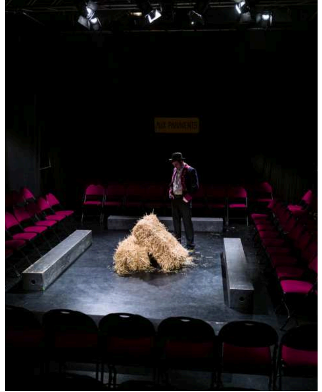
Jeux de lumière et de mouvements avec la paille.

> Pour réfléchir à ce qui fait de la représentation un moment partagé entre les comédiens et le public, répartir au hasard dans des groupes d'élèves des papiers avec les indications ci-dessous. Chaque groupe doit se remémorer et expliquer à la classe le plus possible d'éléments concrets et précis de la représentation qui créent cet effet.