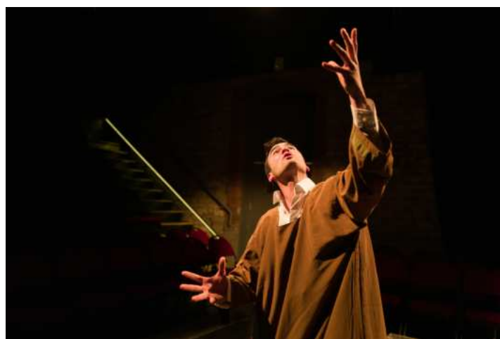
Recherche de l'expressivité des corps.