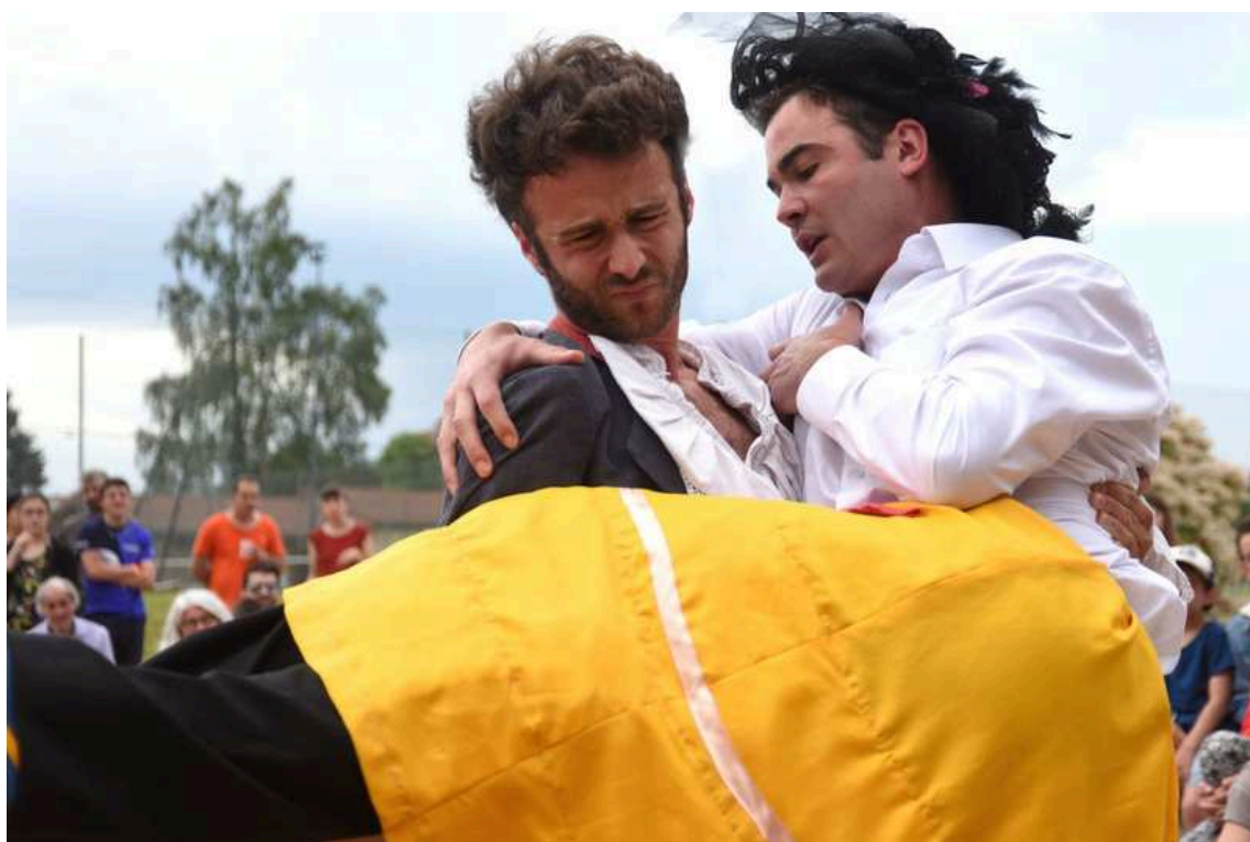
Le mariage : un jeu de dupes pour les personnages ?

Dorimène est une jeune fille issue de la noblesse désargentée. Elle est maltraitée par une famille où la brutalité domine et pense échapper à son environnement grâce à un mariage avec ce vieil homme. Néanmoins, cette jeune coquette appétissante et faussement stupide ne se fourvoie-t-elle pas en concevant le mariage avec un vieil homme comme une échappatoire ? Elle affiche un drôle de cynisme (dépenser l'argent de Sganarelle pour être conquête ; recevoir/faire la fête ; entretenir des relations extra-conjugales) dans ses paroles. Mais elle n'entend pas les fantasmes de son vieux fiancé qui veut la posséder quand bon lui semble, jouir de son jeune corps à loisir. Elle veut ignorer que ce cinquantenaire semble encore vert et vigoureux anéantissant son espoir d'un veuvage rapide synonyme d'une plus grande liberté d'action pour elle.