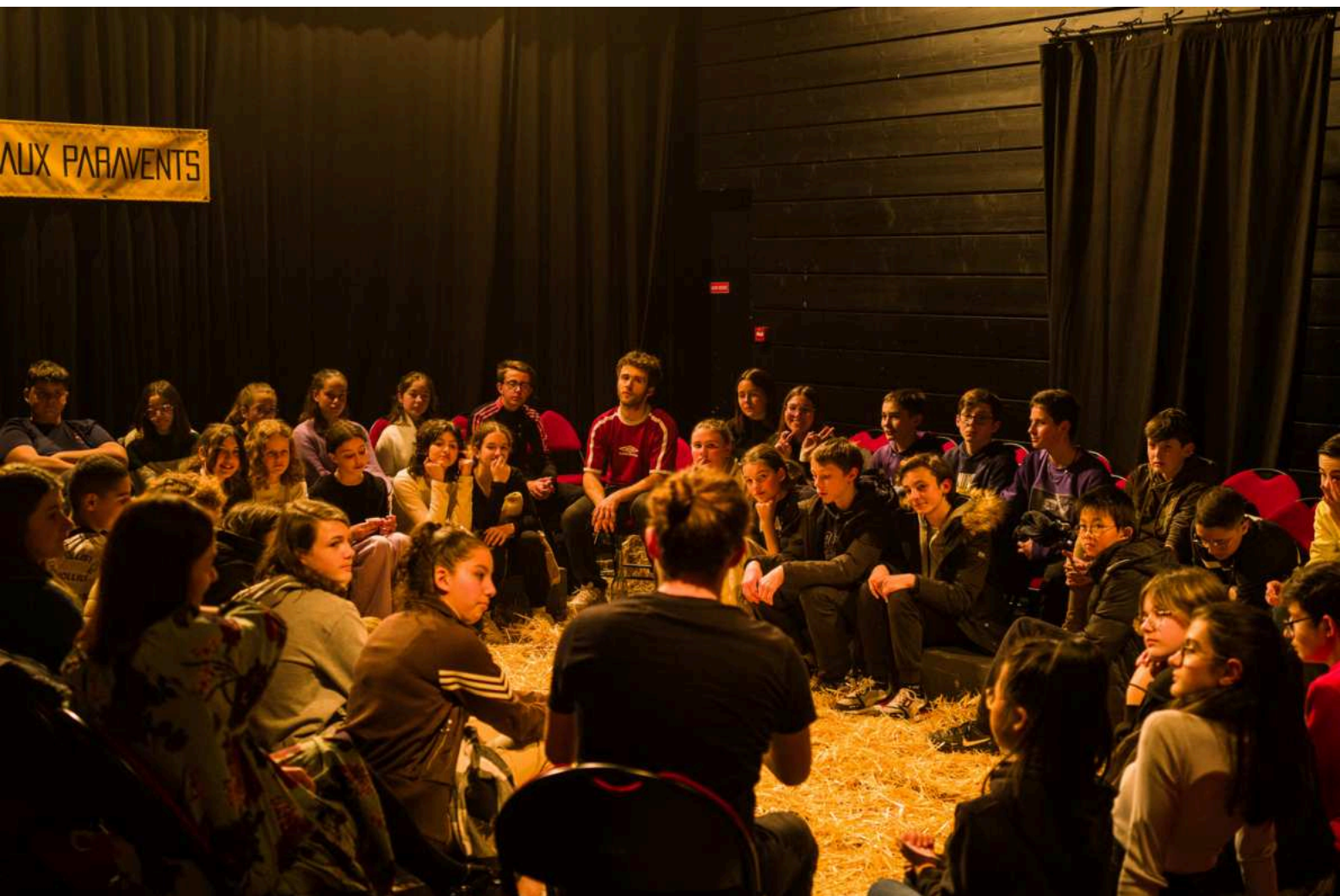
Le traditionnel "bord plateau".

Enfin, la volonté de rapprochement avec le public qui guide le spectacle aboutit logiquement à l'échange qui est proposé à la fin, où les trois comédiens répondent aux questions et expliquent leur démarche.