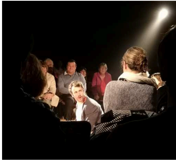
Le public dans la lumière, comme les comédiens.

Quelles que soient les réactions exprimées par les élèves, voir les autres spectateurs / spectatrices, leur regard, leurs réactions, leurs émotions, contribue à faire de la représentation une expérience commune. Cela crée aussi la possibilité d'intégrer le public dans le jeu.